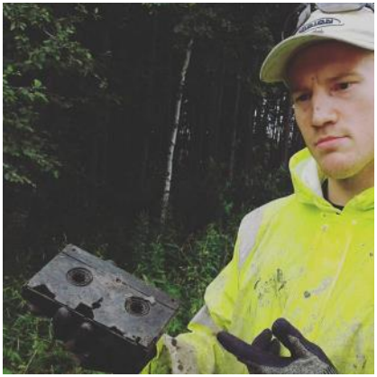
” Muinaismuisto” löytyi purosta