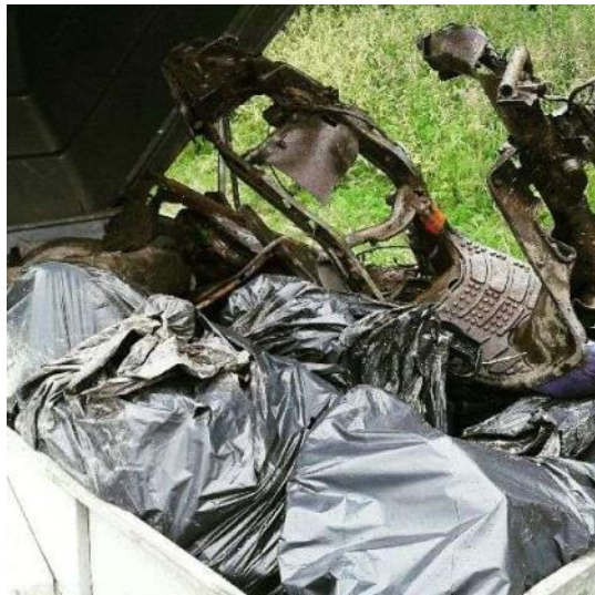
Kylmäojalta länsi- ja pohjoishaaran risteyksestä